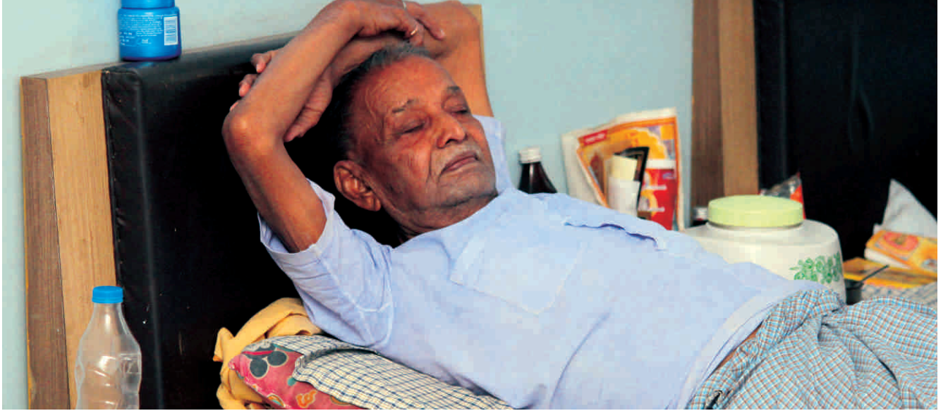
एक वरिष्ठ नागरिक आराम करते हुए

कमरे व जॉरमिटरी हॉल मिलाकर लगभग 150 बुजुर्गों के रहने की व्यवस्था होगी। परिसर में ही पूजा हेतु मंदिर व सुबह – शाम सैर हेतु ट्रेक आदि। शहर के मध्य होने से इस वृद्धाश्रम के बुजुर्ग लोग बाजार निकटतम पार्क में व्यायाम हेतु आ जा सकते हैं। आवासीय किचन परिसर में ही समस्त वृद्धाश्रम वासियों हेतु नाश्ते और पौष्टिक व स्वादिष्ट भोजन की व्यवस्था। इंडोर गेम्स, कॉमन हॉल, टीवी के अतिरिक्त बुजुर्गों को समय-समय पर निकटवर्ती रमणीय एवं धार्मिक स्थलों के दर्शनार्थ ले जाना। वृद्धजनों के लिए पाक्षिक स्वास्थ्य जाँच, दवाइयों व नर्सिंग सुविधाएँ उपलब्ध होगी तथा गंभीर अवस्था में उन्हें तुरंत निकटवर्ती अस्पताल पहुँचाने की व्यवस्था रहेगी।