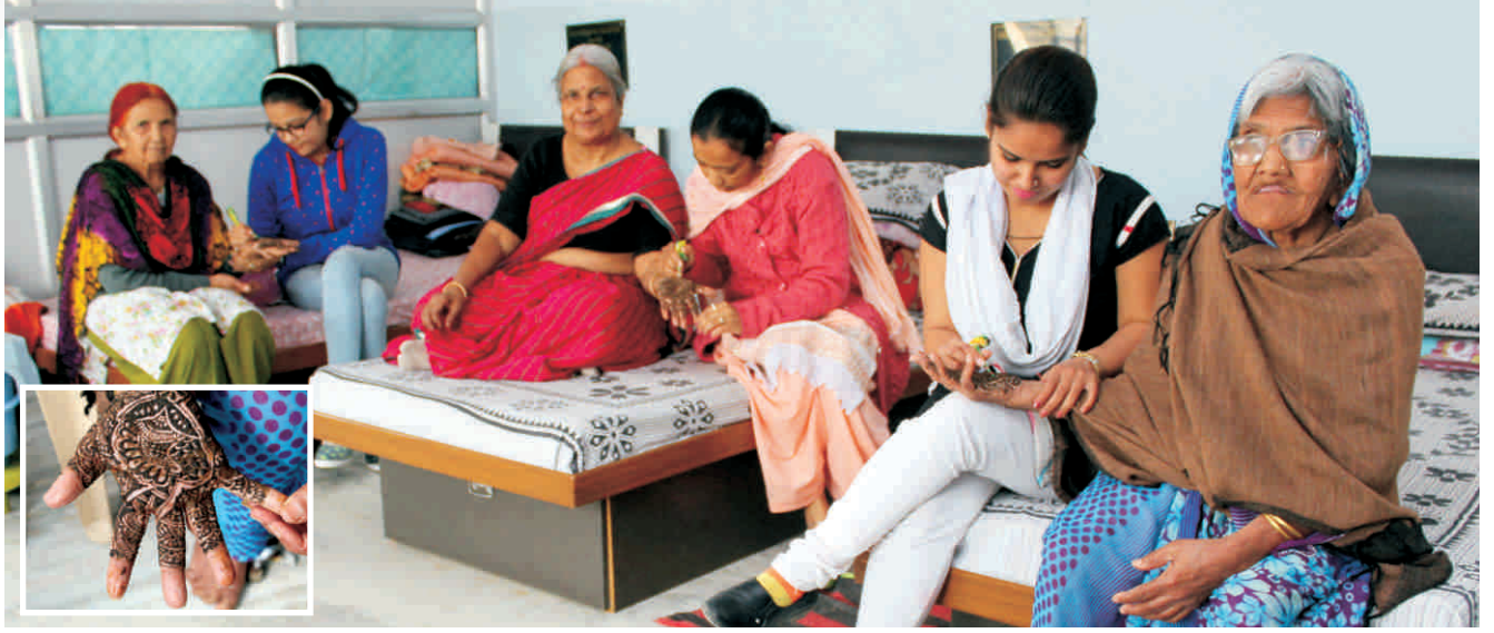
कुछ बालिकाएँ वृद्धजनों के मेहंदी लगाते हुए