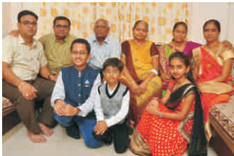
कछरोला परिवार, मोरबी (गुज.)