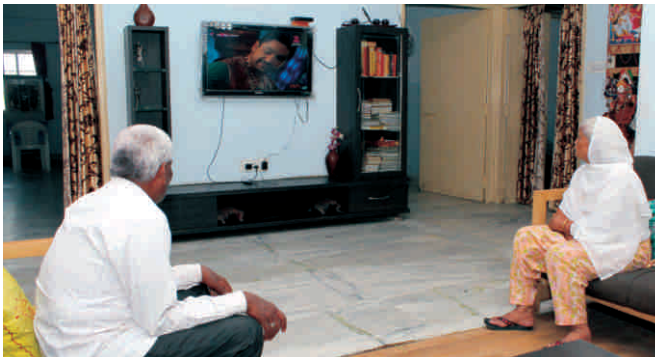
टी.वी. देखते बुजुर्ग