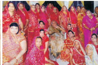
दिगम्बर जैन महिला मण्डल, फतेहपुर शेखावती सीकर (राज.)