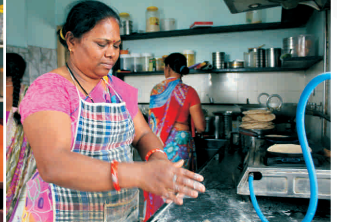
महिलाएँ भोजन बनाती हुई