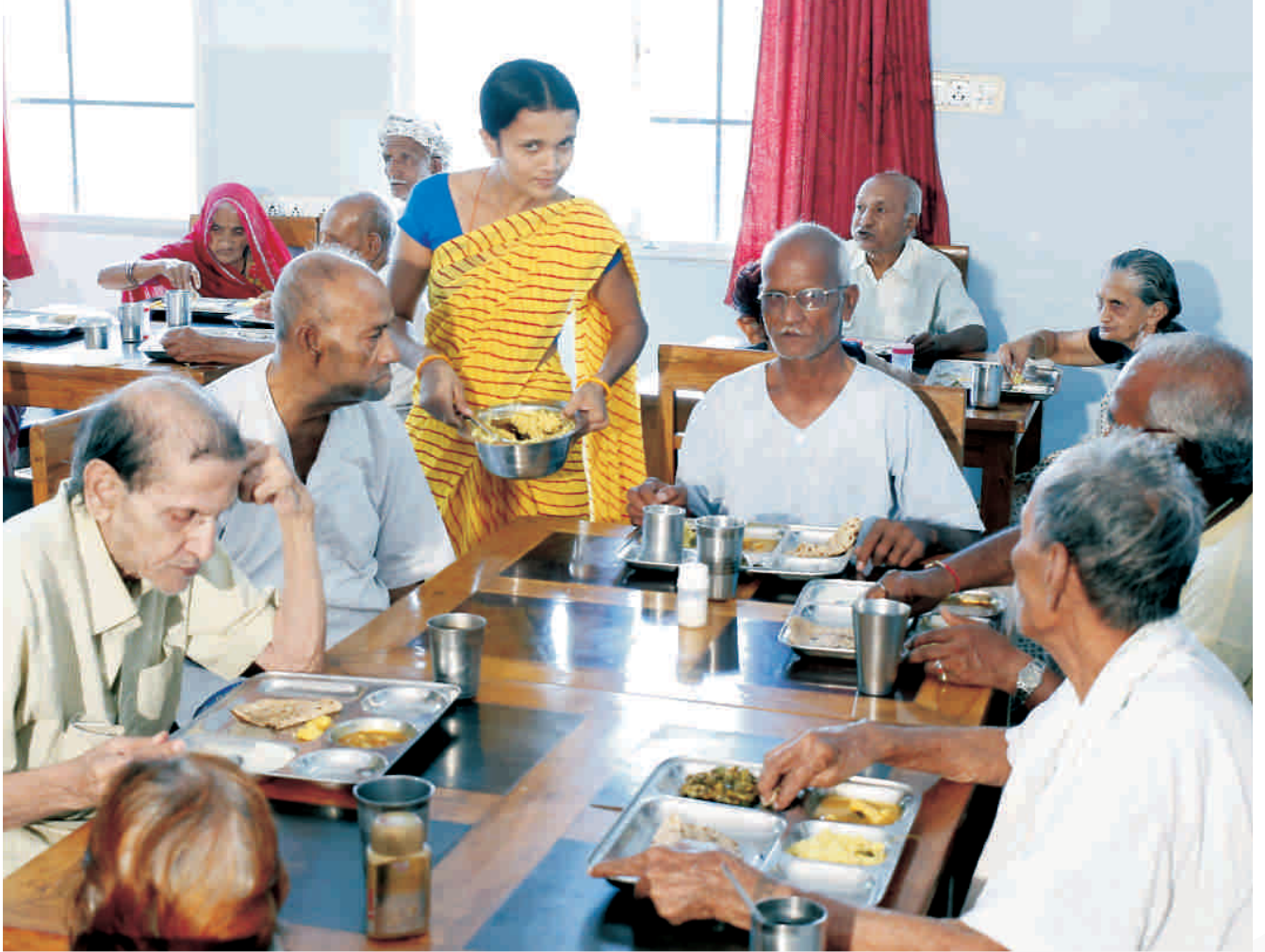
डाईनिंग हॉल में ताजा भोजन करते हुए