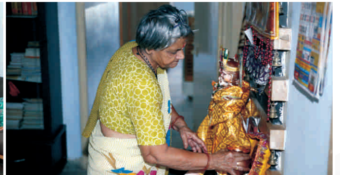
एक महिला पूजा करते हुए