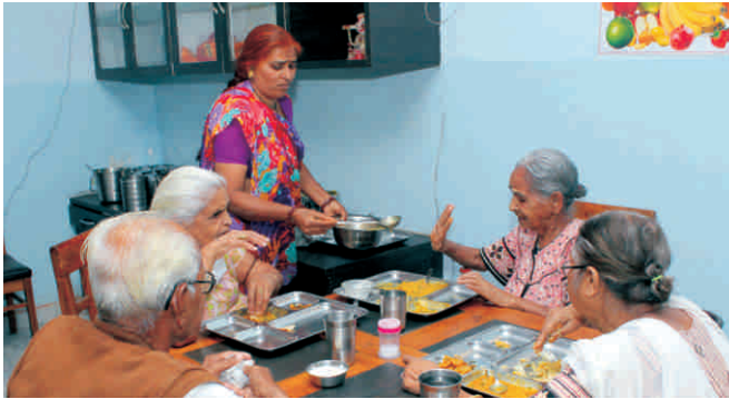
भोजन टेबल पर वरिष्ठ जन