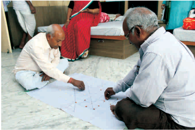
दो मित्र चंगा बित्ति खेलते हुए