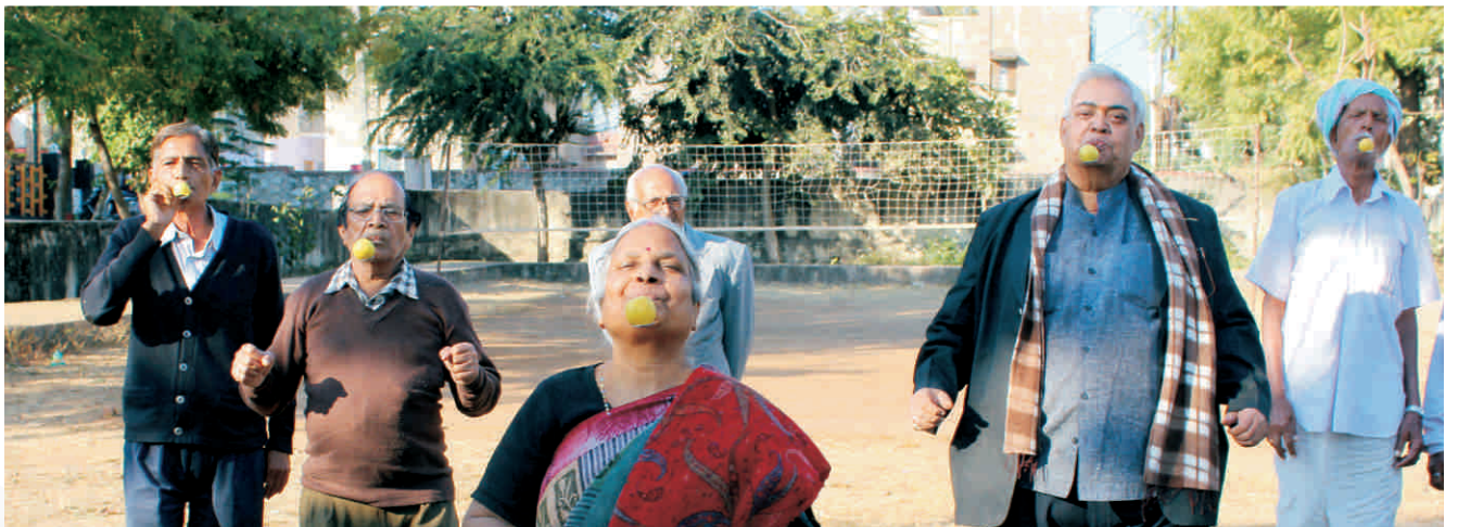
निम्बू-चम्मच रेस में भाग लेते हुए वरिष्ठ जन

कोई व्यक्ति अपने अधिकारों से ज्यादा अपने हितों के लिए लड़ेगा।