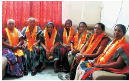
बी.आर. ज्वैलर्स दिल्ली