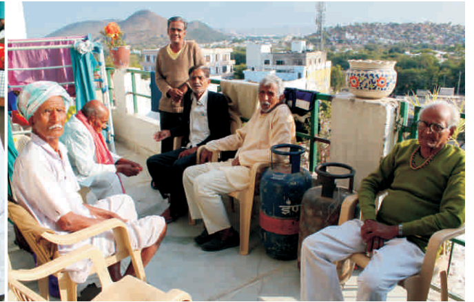
कुनकुनी धूप का आनन्द लेते